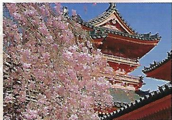
八重紅枝垂桜: Drooping cherry trees